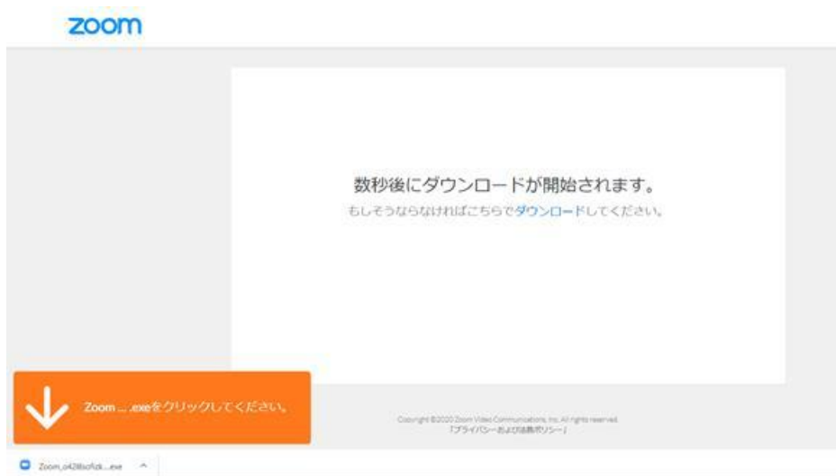
(ブラウザが Chrome の場合)